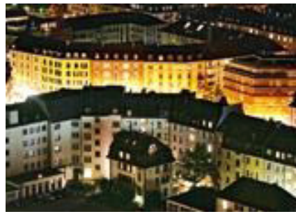
Kaum gegen Verluste abzusichern: Wohnhäuser in Zürich Albisrieden.

Immobilien-Hedge-Funds haben im «annus horribilis» Stärke gezeigt. Einige erzielten in den fallenden Märkten sogar Gewinne.